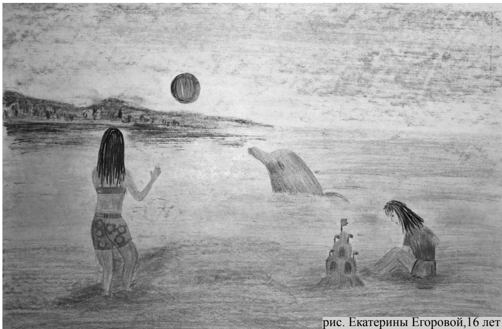
рис. Екатерины Егоровой, 16 лет