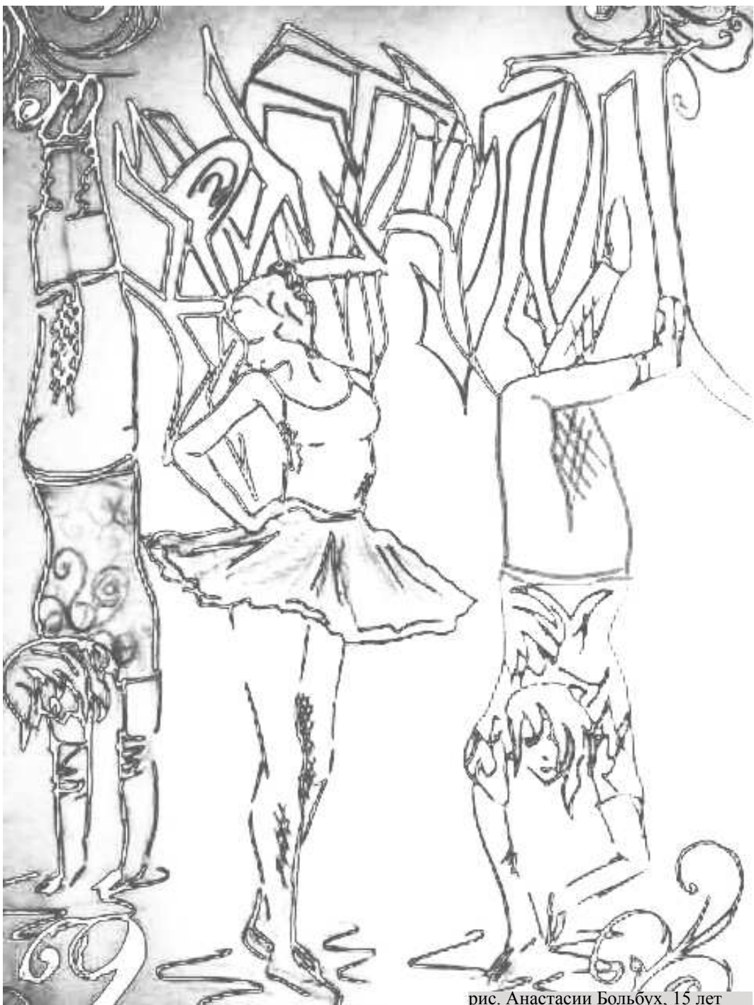
рис. Анастасии Большух, 15 лет